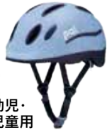
幼児・児童用ヘルメット