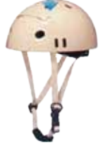
ファッション性の高いヘルメット