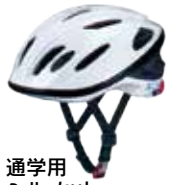
通学用ヘルメット